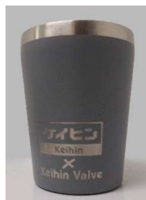
レーザー刻印(参考写真:コルク/タンブラー/ステンレス名刺)